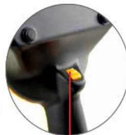
Photo / video button Ergonomic design-easy operation