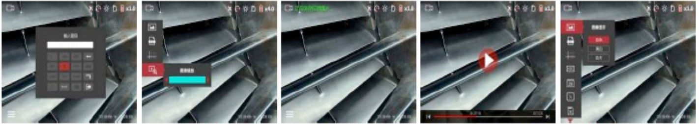
הגנת כניסה עם סיסמא