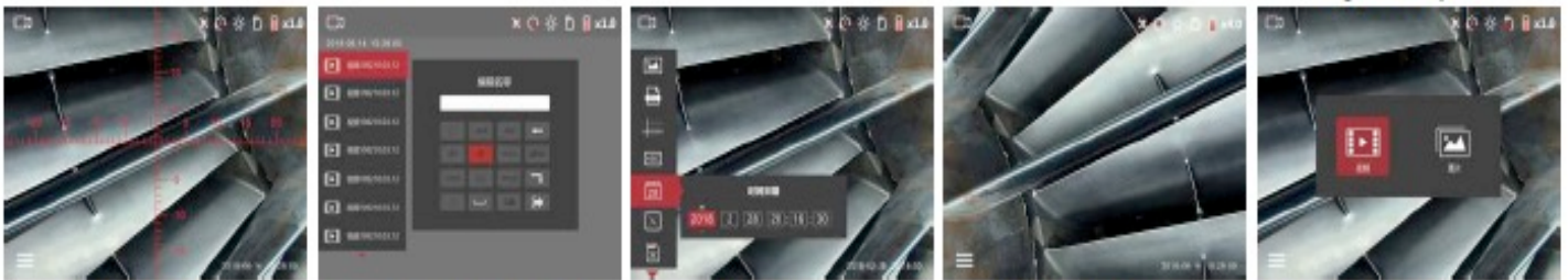
אופציה לצלב שנתות